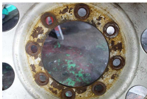
ディスクホイール