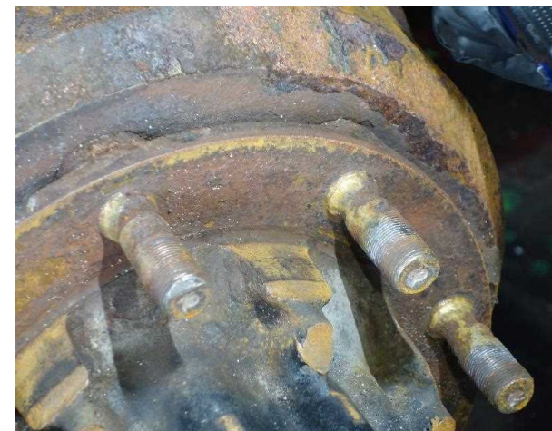
ホイール・ボルト、ハブ