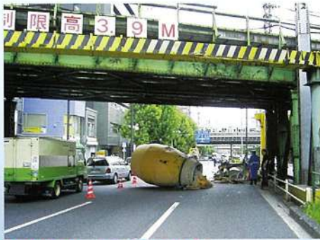
小柳橋ガード 靖国通り