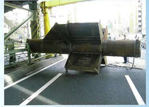
万世橋ガード 中央通り