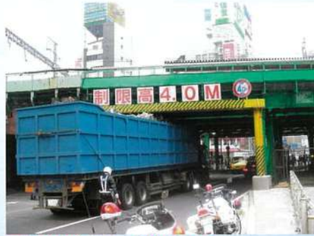
二葉橋ガード 外堀通り