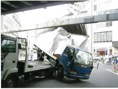
仲原街道ガード 八ツ山通り