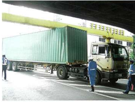
呉服橋ガード 国道1号永代通り