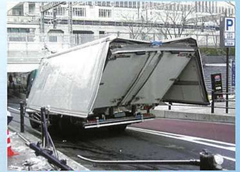
明神坂ガード 神田明神通り