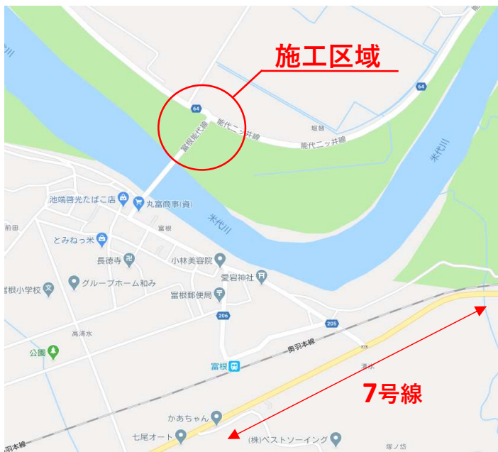
秋田県能代市二ツ井町飛根 富根橋