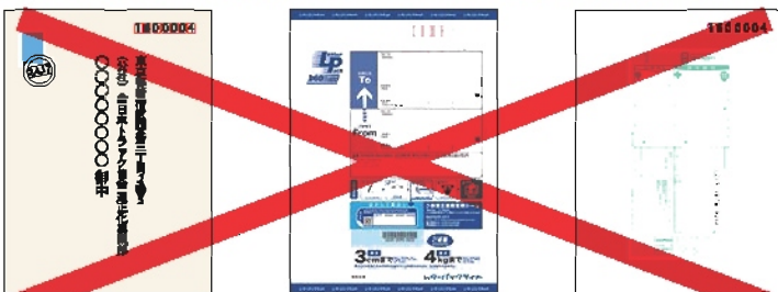
普通郵便 特定記録郵便