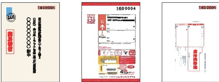
一般書留郵便 簡易書留郵便